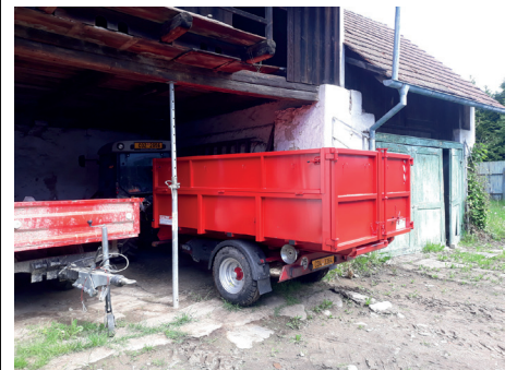
kontejnerový vanový zásobník

Poslední dotační projekt z fondu Jihočeského kraje, který obec využila, byl nákup vybavení pro provoz prodejny a rekonstrukce elektrických a vodovodních rozvodů, výměna osvětlení, bojleru a sanity. Celkové náklady činily 171 156,- Kč. Na realizaci projektu se podařilo získat dotaci ve výši 87.000,- Kč.